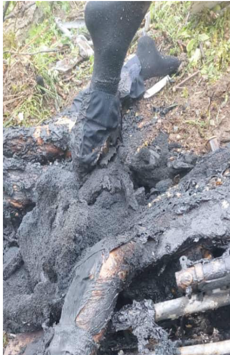
ماتبقى من جثة رئيسي بعد ان أضحت رماد

وثانية نقول مع الفارق الشاسع ما بين الحدثين، إن