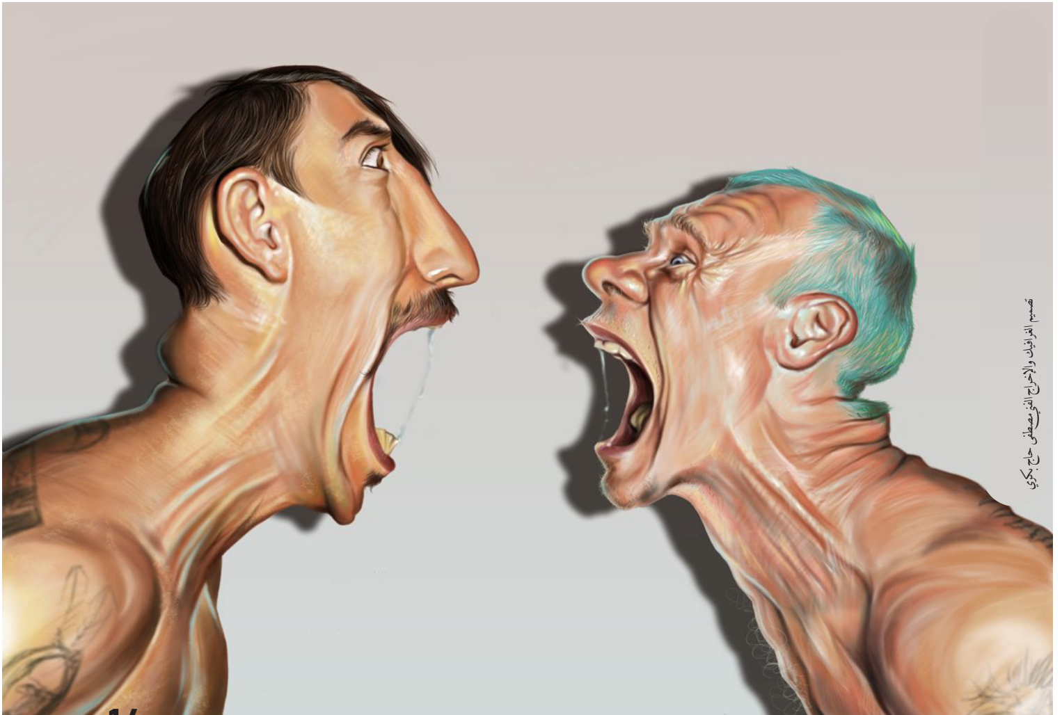
تصميم: الفنانين والإخراج الفني: مصطفى حاج بكري