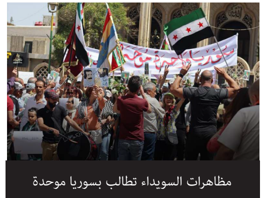
مظاهرات السويداء تطالب بسوريا موحدة

يجعله أمام تحدٍ جديد عنوانه هل سيتمكن من تنفيذ مخططاته دون رد من السويداء! في سياق آخر، وقبيل الدعوة للقمة العربية، ورغم عقد النظام انتخابات لحزب البعث وانتخاب أمانته العامة وقيادته، أصدر مرسوماً يقول فيه بفصل حزب البعث عن أجهزة الدولة والتحضير لانتخابات مجلس الشعب منتصف الشهر القادم، ليذهب لحضور القمة وفي جعبته الكثير من عمليات التحسين والتجميل التي قام بها! أحقية السلمية سياق أحقية السلمية في الحل السوري والتغيير السياسي، والمطالبة به من السويداء والسوريين جميعاً، يقف أمام سباقات مع الزمن من نمط آخر: - سباق المسافات القصيرة على المصالح المحلية بالاستحواذ على مقدرات سوريا. - سباق تلميع صورة النظام أمام جامعة الدول العربية والنظام العالمي. - سباق الخروج من الاستعصاء السوري ودوائر الصراعات العنيفة وإمكانية تجدها. - فيما السباق الأطول والذي يمثل جوهر الصراع السوري، صراع حق السوريين بالحياة الكريمة في جولة تحقق الحرية والكرامة لكل السوريين. وحيث إن التطبيع مع سلطة النظام القائم وعدم الدخول في المرحلة الانتقالية سيبقي سوريا محطة للنزاعات الدولية والإقليمية المتعددة الجهات، وستبقى سوريا مزرعة لتجارة المخدرات لدول الخليج العربي والعالم، والسويداء ممر لها. كما أن شباب وشابات السويداء سيبقون عرضة للاعتقال والملاحقات الأمنية، وسيبقى الوضع الاقتصادي والحريات والتعليم يزداد كارثة، وسيبقى التغيير الديموغرافي وهجرة السوريين بكل الطرق الشرعية وغير الشرعية عنواناً لكارثة إنسانية كبرى في القرن الواحد والعشرين.