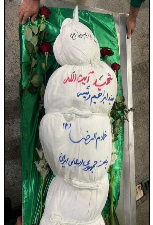
جثة رئيسي قبل الدفن